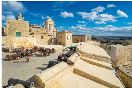
Citadelle de Victoria

Gozo est accessible depuis le Terminal Ferry de Cirkewwa, toutes les 45 mn. Le trajet dure 25 mn et coûte 4,65€.