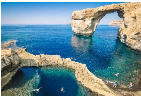
Azure Window, Dwejra Bay