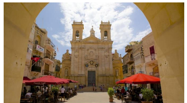
Basilique Saint -Georges

Les bus 41,42,221,222,X1,101,102 permettent d'accéder au terminal de Cirkewwa.